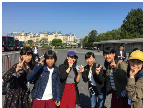
東京ディズニーランドにて