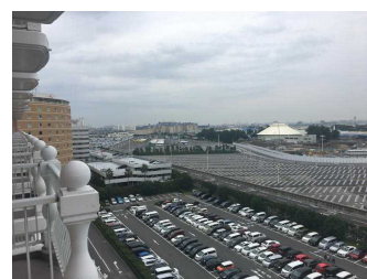
ホテルからの風景（舞浜）