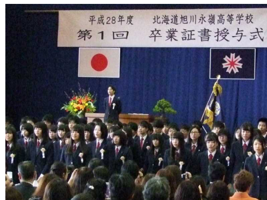
卒業生による卒業セレモニー （「旧旭川凌雲高校校歌」斉唱）