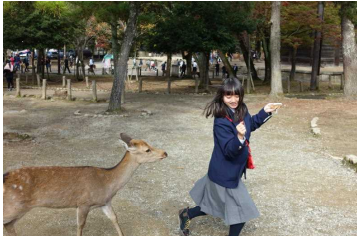
鹿に追いかけてられて・・・