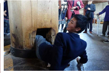
くぐれたら頭が良くなる とか・・・