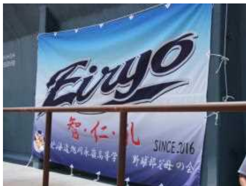
野球部父母の会の応援旗