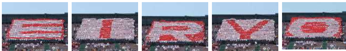
旭川永嶺高校 全校応援 人文字