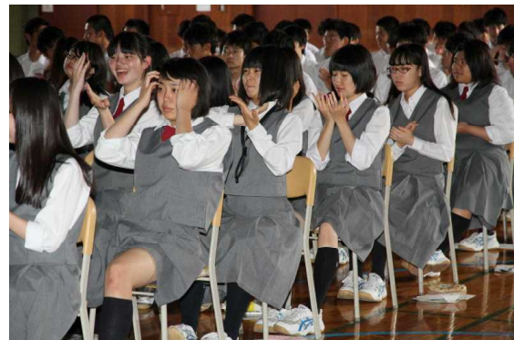
リラックス対策の実践